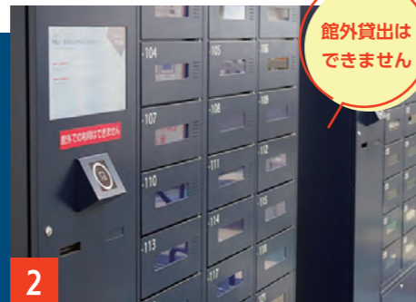
2 PC貸出ロッカー ノートPC: 30台 ノートPC、プロジェクターなどグループでの学習に便利な機器をセルフで借りられます。