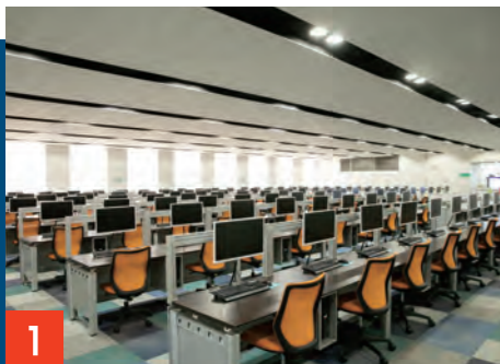
1 PCステーション1 PC台数: 125台 館内の資料を使ってレポートやプレゼン資料を作成したり、インターネットで情報収集やデータベース検索をしたり。印刷もできるので課題にフル活用できます。