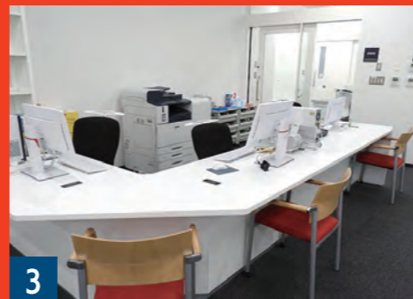
3 メディアサポートデスク グループ学習室の利用申込はこちらから。MELIC資料の貸出更新・返却もできます。