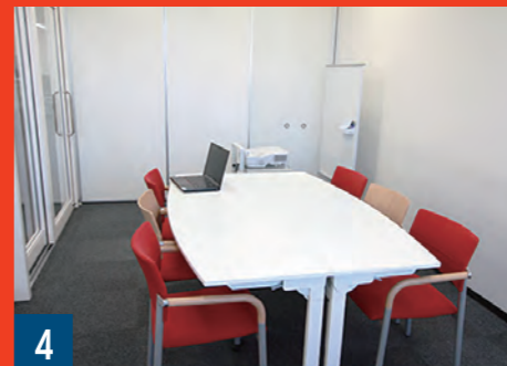
4 グループ学習室5~8 必ず2名以上で使ってください。プロジェクターとノートPCを使えば、グループでプレゼン練習もできます。