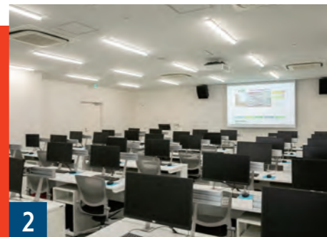
2 情報学習室2・3 PC台数: 96台 プレゼンテーション機器完備のメディア室です(教員予約制)。PCステーション2の混雑時は、PC利用席として開放しています。