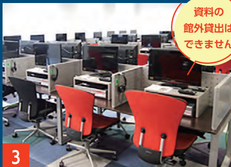
3 AVコーナー 席数: 40席 映画、ドキュメンタリー、音楽など約18,000点のCD・ビデオ・DVDから好きな資料を選んでブースで視聴することができます。利用時間: 3時間